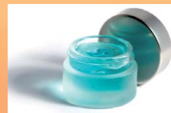
Kleine bzw. Kleinst-Teile